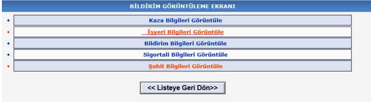
Şekil 14-Bildirim Bilgileri Görüntüleme

“Görüntüle” butonuna basılması halinde, bildirimle ilgili bilgiler kategoriler halinde gösterilmektedir. Her bir seçimde bildirimle ilgili ayrıntıya ulaşılabilir.