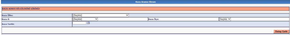
Şekil 4-Kaza Arama Ekranı

İkinci sayfada kazanın meydana geldiği yere ilişkin bilgilerin girileceği ekrana ulaşılmaktadır.