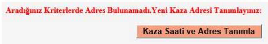
Şekil 6-Kaza Saati ve Adres Tanımlama

Girilen kaza tarihi, il ve ilçe bilgileriyle sistem üzerinden girilmiş herhangi bir kaza yok ise söz konusu seçim ekranı gelmemektedir. Aynı tarihte fakat farklı bir saatte kaza girişi yapılacaksa gelen kaza listesinden seçim yapılmadan “Mevcut listede yok, yeni kaza saati ve adresi tanımla” butonu ile yeni kaza saati ve adresi girişi yapılmalıdır.